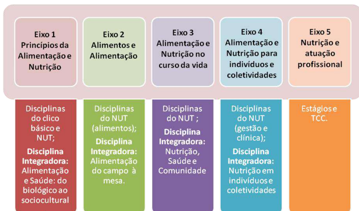
Figura 1. Eixos temáticos integradores do currículo do curso de Nutrição

As disciplinas e as atividades foram elaboradas e organizadas na perspectiva de articular teoria e prática, desde o início da formação, e potencializar o compromisso com o SUS e com as necessidades de saúde da população.